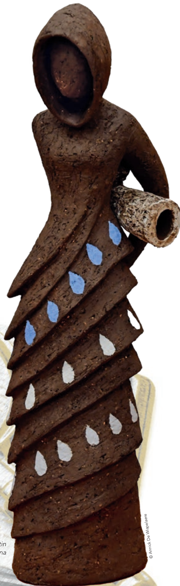
Die Prophetin Hanna

Auf die Frage nach bedeutenden Personen der Bibel werden vor allem Männer genannt: Jesus mit den (männlichen) Jüngern und Paulus im Neuen Testament sowie Abraham, Mose und David im Alten Testament. Die eng mit diesen Männern verbundenen Frauen, Sara, Mirjam und Batseba sowie Maria Magdalena kommen oft erst bei weiterem Nachdenken in den Blick.